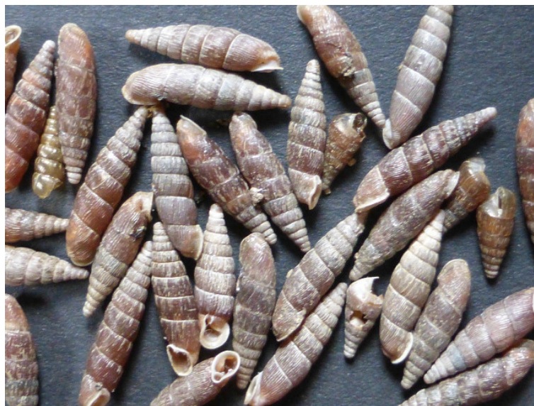
Clausilia pumila , die Keulige Schließmundschnecke, vom Großen Waldstein / Fichtelgebirge aus der Sammlung Dr. Klan, Fund 1959.

Dieser Sammlungsteil wird laufend durch Eigenfunde und Schenkungen erweitert. Die Bestimmung erfolgt mit Hilfe von Fachliteratur, was aber bei der mit ca. 300 Arten von Land- und Süßwasserschnecken in Deutschland einigermaßen überschaubaren Artenvielfalt keine größeren Probleme bereitet. Weitere Zustiftungen auch aus anderen Regionen Deutschlands wären wünschenswert.