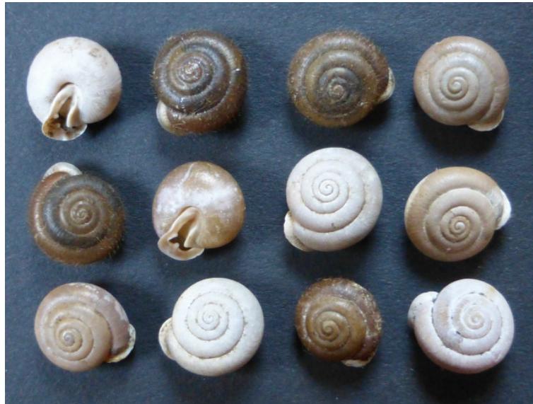
Isognomostoma isognomostomos , die Maskenschnecke, von der Ruine Nordeck bei Stadtsteinach.

Wer an Schnecken denkt, dem kommen sicherlich zuerst die großen Nacktschnecken in den Sinn, die oft in großer Zahl auf Wegen ihre schleimigen Spuren hinterlassen und dem Kleingärtner über Nacht die Pflanzen wegfressen. Auch die weniger gefräßigen „Gartenschnecken“ mit ihren bunten Gehäusen kennt jeder. Es sind faszinierende Lebewesen! Die kleineren Arten ernähren sich überwiegend von Algen oder abgestorbenen Pflanzen und sind so völlig unschädlich.