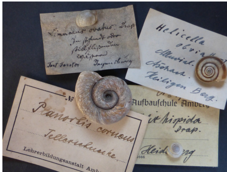
Historische Sammlungsetiketten aus Amberger Beständen.

Auch der Grundstock dieses in drei Schubladen untergebrachten Sammlungsteils stammt aus Amberger Beständen. Datierte Etiketten des Amberger Naturalienkabinetts für rezente Schneckenarten geben das Jahr 1847 an, Teile dürfen aber noch einige Jahrzehnte älter sein. Eine Katalogisierung und Nummerierung, wie bei den Mineralien und Fossilien, gibt es aber nicht. Auch fehlen bei vielen Exemplaren genaue Herkunftsangaben. Die recht genauen Bestimmungen entsprechen dem Stand der damaligen Zeit.