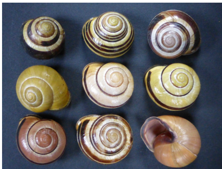
Cepaea nemoralis , die Hain-Schnirkelschnecke, vom Steinbruch Sinatengrün.

Die meisten Schnecken leben im Verborgenen und sind oft nur durch gezielte Suche auffindbar. Außerdem sind viele Schneckenarten auf ganz bestimmte Lebensräume, wie Trockenrasen, feuchte Mauer- und Felswände, Laubmischwälder, Sumpfwiesen oder naturnahe Gewässer und die dort vorkommenden Pflanzen angewiesen. Manche Schneckenarten leben unter Moos oder im Mulm teilzersetzer Pflanzen. Mit der Verarmung unserer Landschaft an solchen Biotopen sind nicht nur viele Pflanzen vom Aussterben bedroht, sondern auch die dort lebenden und von ihren ökologischen Nischen abhängigen Schneckenarten.