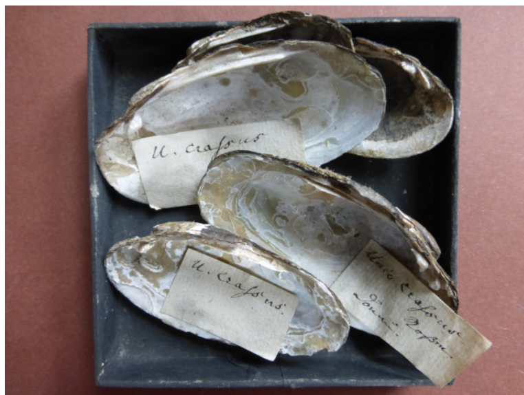
Unio crassus , die Bachmuschel, aus der Donau – heute dort wohl ausgestorben!

Von diesen durch Gewässerüberdüngung, Verschlammung und neuen Fraßfeinden, wie Bismarcke und Waschbär stark bedrohten Mollusken, sind zahlreiche Exemplare aus einer Zeit erhalten, wo es noch Großbestände in vielen Bächen gab. Teichmuscheln sind heute selten geworden. Flußperlmuscheln leben nur noch in ganz wenigen Bächen und sind akut vom Aussterben bedroht.