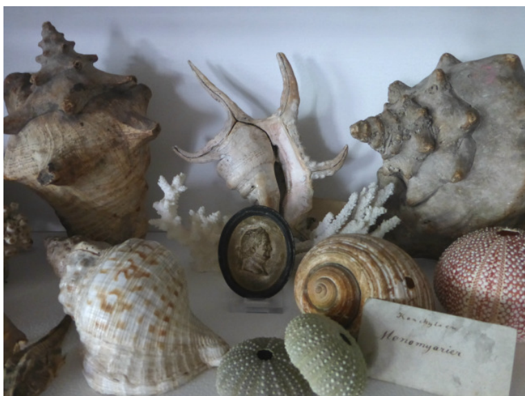
Ausschnitt aus der Vitrine mit den größeren Schaustücken.