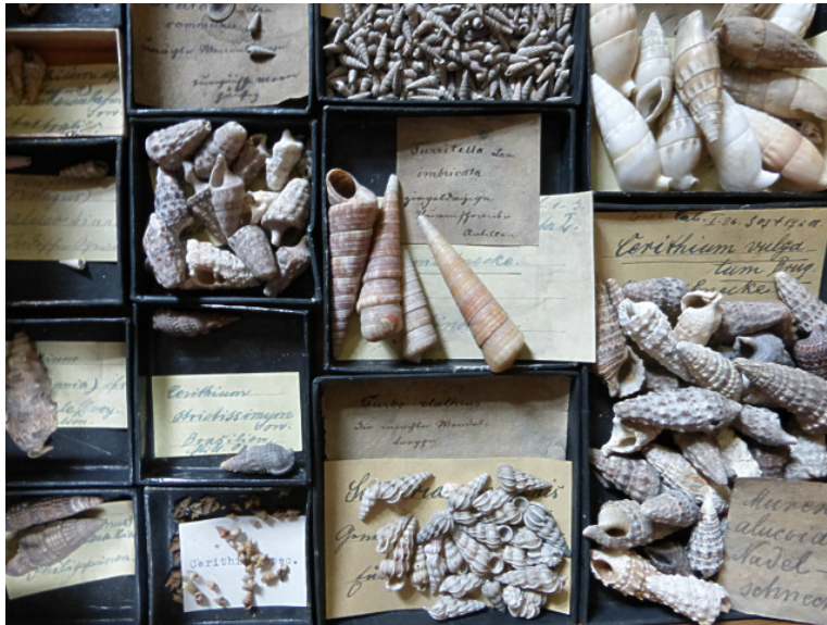
Blick in eine Schublade mit Turmschnecken.

Den Grundstock dieser Sammlung bilden historische Bestände des 2009 aufgelösten Amberger Naturalienkabinetts. Dieses entstand um 1806 im Zuge der Säkularisierung aus den enteigneten Naturalien-Sammlungen der Klöster Ensdorf, Michelfeld und Waldsassen. Als zentrale Sammelstelle der Oberpfalz diente zunächst das Lyceum in Amberg, einer 1723 gegründeten und 1865 aufgelösten hochschulähnliche Bildungseinrichtung, die mit dem „Jesuitengymnasium“ (ab 1914 „humanistisches Gymnasium“) im Malteser-Gebäude untergebracht war. Spätere Standorte waren die Lehrerbildungsanstalt und das Max-Reger-Gymnasium.